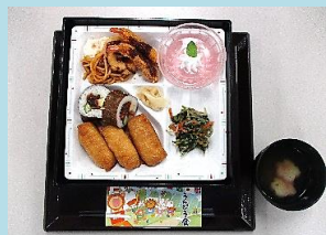
10/9 スポーツの日メニュー