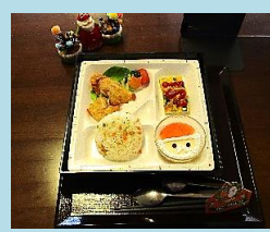
12/25 クリスマスマニュー

他、10月、十三夜御膳、防災の日メニュー、ハロウィンメニュー、11月、文化の日御膳、12月、冬至御膳、年越しそば 等